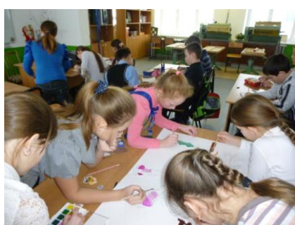
В 5 классе все художники