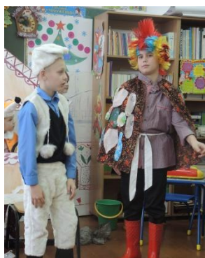
Праздник петушков в 1-4 классах