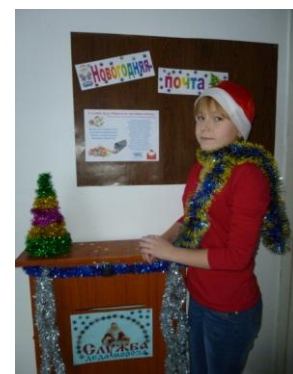
Письма и посылки будут доставлены в срок