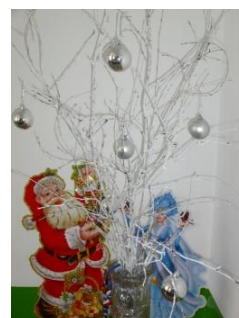
Букет учеников 8 класса