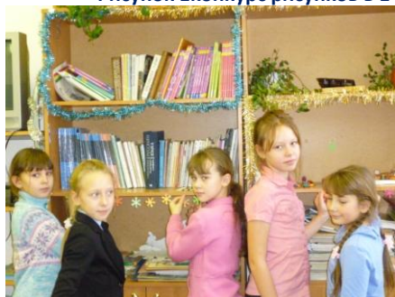
Дизайнеры из 4 класса