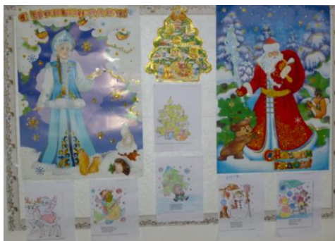
Рисунок 1 конкурс рисунков в 1 классе