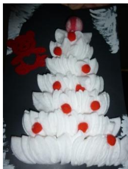
Поделки ребят 2 класса