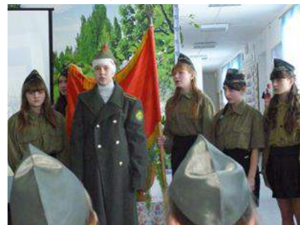
матросов, умеющих это оружие

искусно применить. Всё это было присуще Красной Армии. Народ и армия, фронт и тыл были едины.